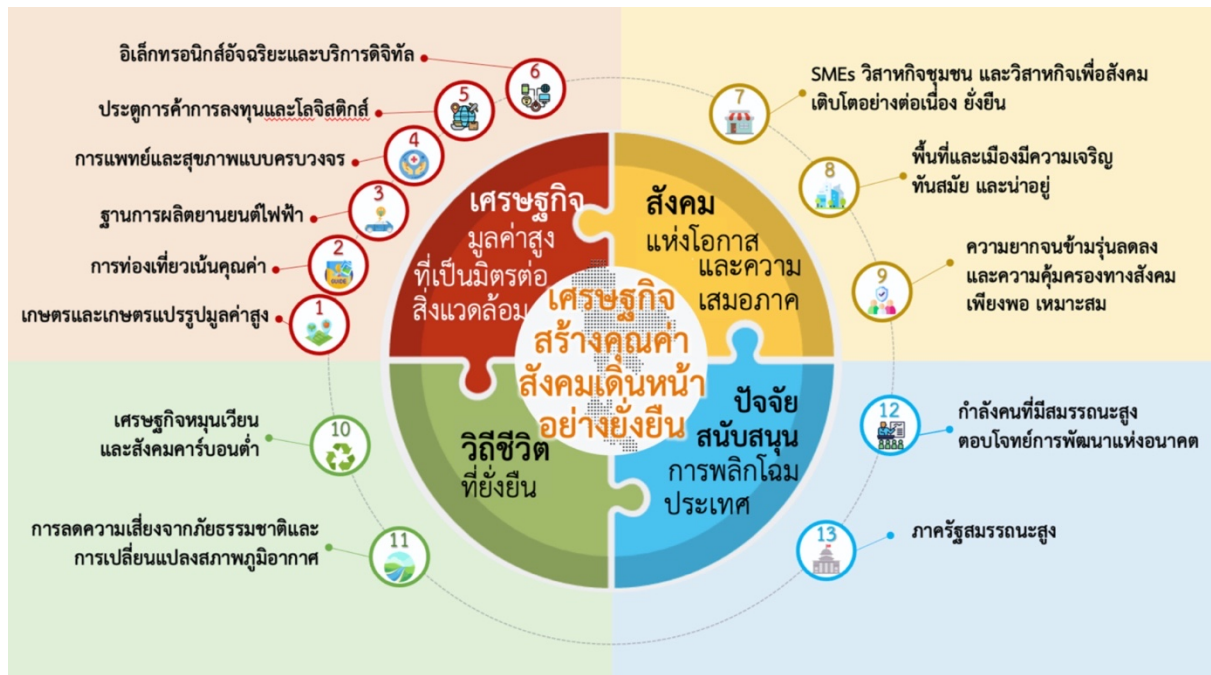
แผนภาพที่ 3 Hi-Value and Sustainable Thailand