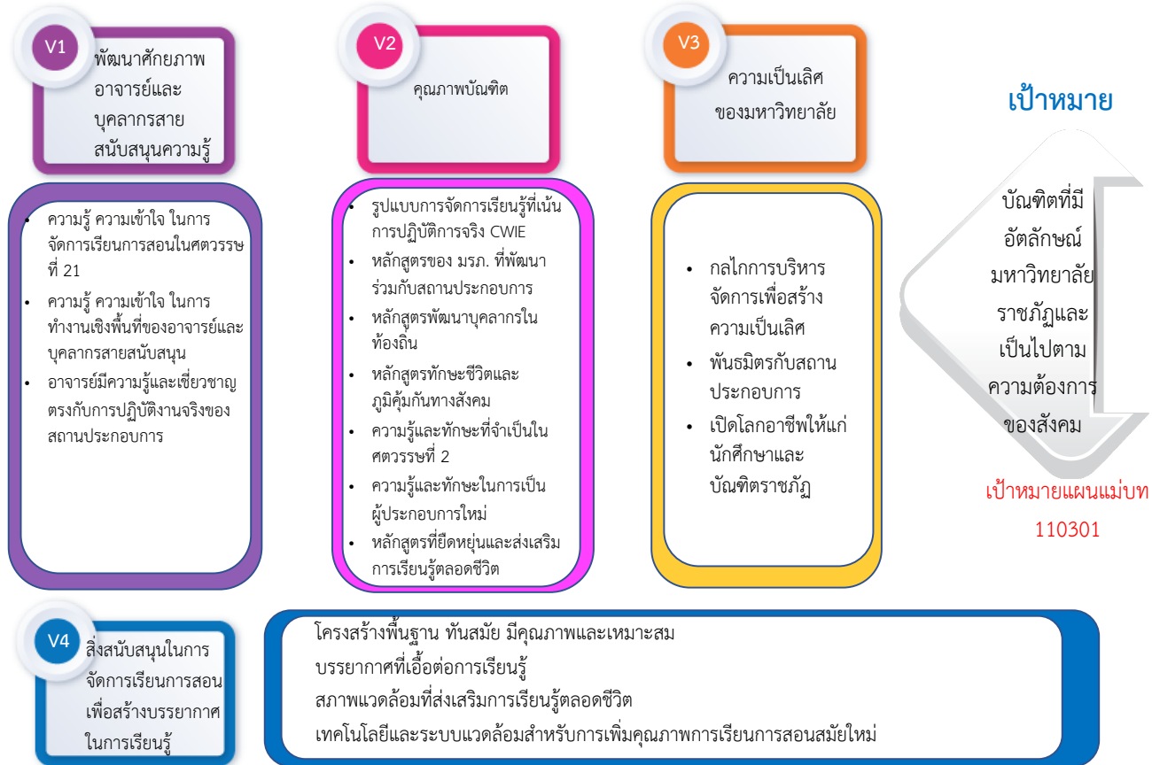
แผนภาพที่ 3 Value Chain ยุทธศาสตร์ที่ 3 การยกระดับคุณภาพการศึกษา